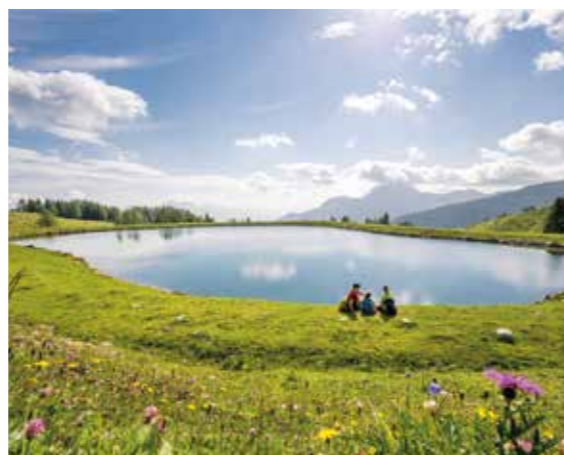
© Michael Stabentheiner / Kärnten Werbung (2)